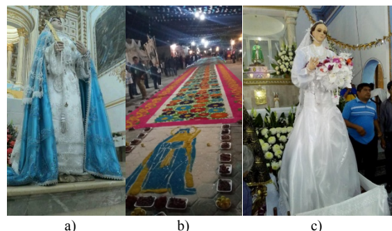
Figura 1. a) Imagen de la Santísima Virgen de la Asunción; b) Alfombra de la procesión en honor a la Santísima Virgen de la Asunción; c) La virgen María en su desposorio.

Día a día se repican las campanas a las 5 de la mañana, rosarios, procesiones, peregrinaciones y sacramentos son algunas de las actividades religiosas más sobresalientes. Sin faltar por supuesto las mañanitas a la Virgen. Sobresalen las magníficas alfombras colocadas en las calles donde pasa la procesión de la Virgen de la Asunción. Fuegos pirotécnicos, bailes, jaripeo, juegos mecánicos, son algunas de las actividades que realiza la población para celebrar la fiesta.